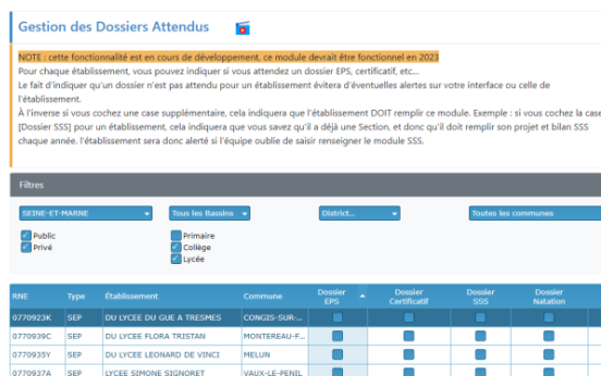
La fonctionnalité en Vidéo

La gestion des dossiers attendus a été améliorée pour éviter les fausses alertes